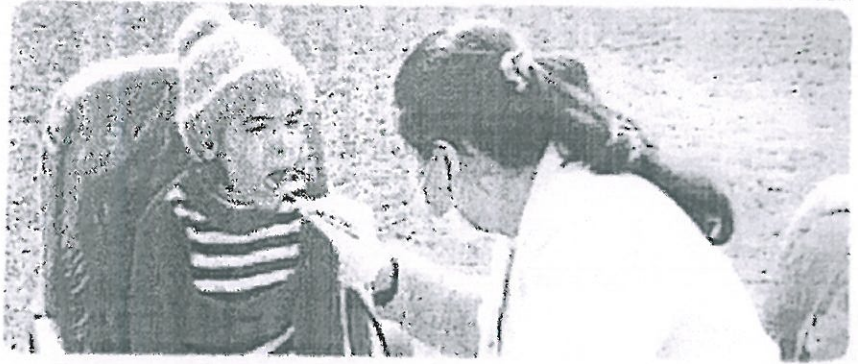
श्रीगंगानगर, शिविर में बच्ची के दांतों की जांच करती चिकित्सक।

शिविर के दौरान आसपास व पार्क में घूमने वाले काफी संख्या में लोग पहुंचे। इनमें से करीब 78 व्यक्तियों के दांतों की जांच कर परामर्श दिया गया। इसके अलावा