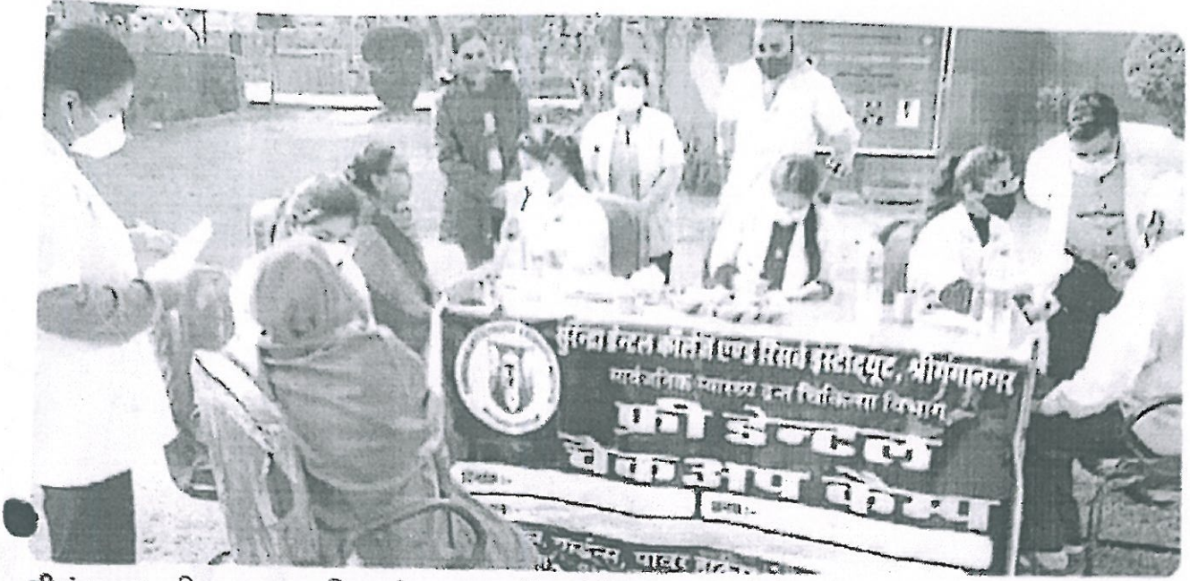
श्रीगंगानगर, पत्रिका स्थापना दिवस के उपलक्ष्य में आयोजित दंत जांच शिविर जांच कराते लोग।